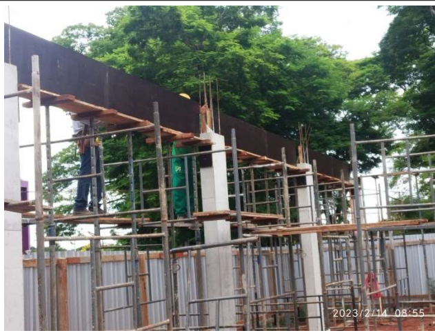
Figura 11 – Formas e armação de vigas e laje – Setor A