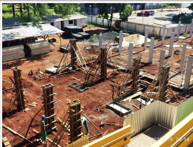
Figura 6 – Pilares – Setores A e B