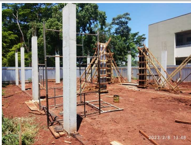
Figura 5 – Pilares Setor A