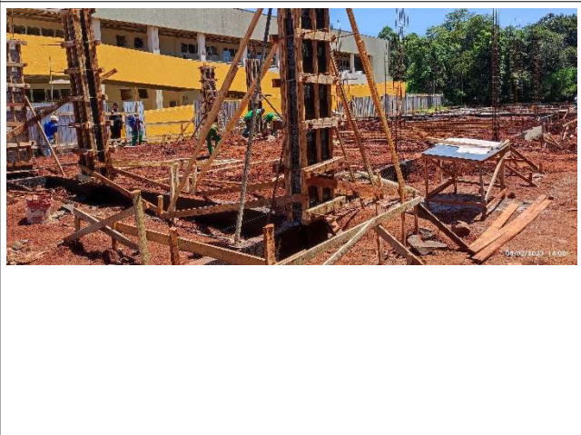
Figura 4 – Formas de Pilares