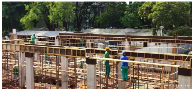
Figura 13 – Escoramento – Setor A