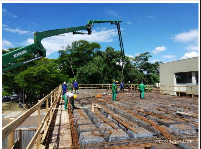
Figura 16 – Concretagem laje e vigas – Setor A