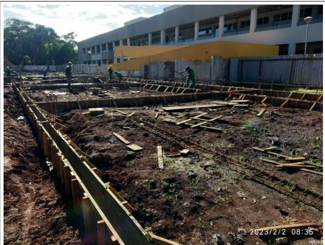
Figura 2 – Formas e armação de baldrames Setor C