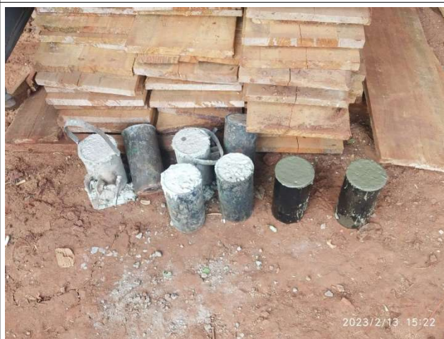
Figura 8 – Corpos de Prova