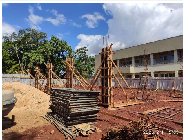
Figura 1 – Armação e formas de pilares Setor A