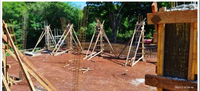
Figura 14 – Armação e forma de pilares – Setor C