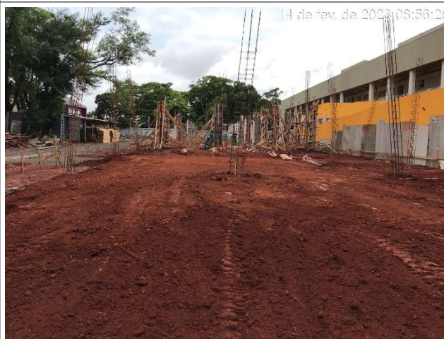
Figura 10 – Armação pilares – Setor C