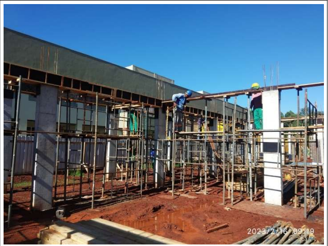
Figura 12 – Escoramento – Setor A