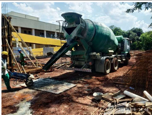
Figura 3 – Concretagem pilares - Setor A