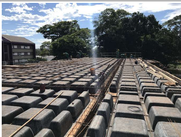
Figura 15 – Cubetas laje – Setor A