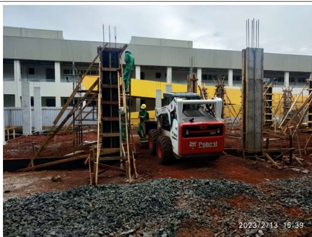
Figura 9 – Concregagem pilares – Setor B