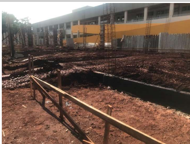
Figura 7 – Reaterros após finalização de baldrames – Setor C