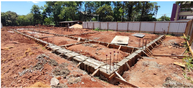
Figura 9 – Baldrame concretados