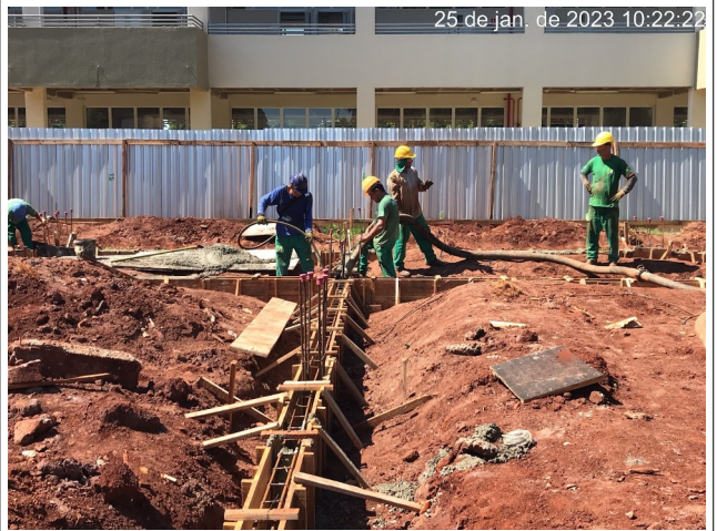
Figura 8 – Concretagem dos baldrames