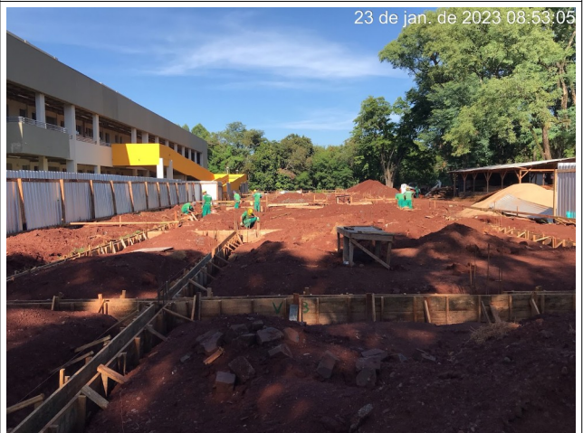
Figura 6 – Armação e formas de braldrame