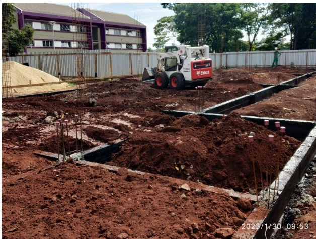
Figura 11 – Reaterro baldrame