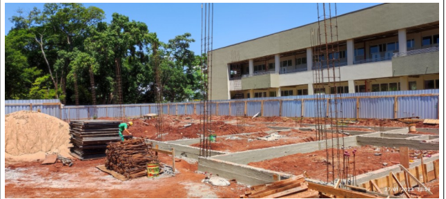
Figura 10 – Armaduras pilares