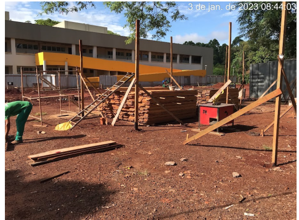
Figura 2 – Cobertura Carpintaria