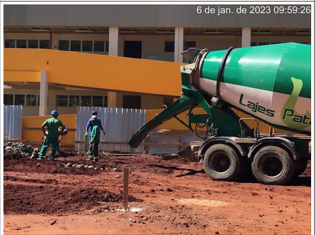
Figura 4 – Concretagem das estacas