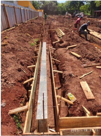
Figura 7 – Formas baldrame