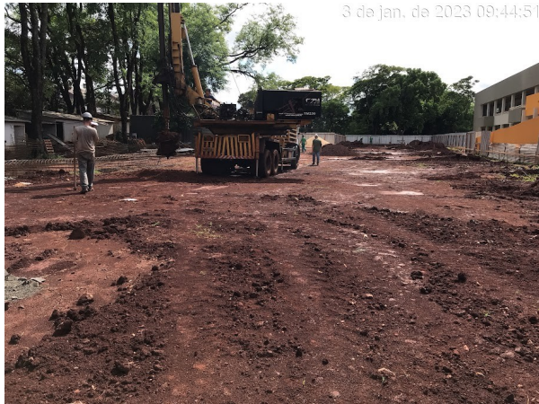
Figura 1 – Perfuração de estacas