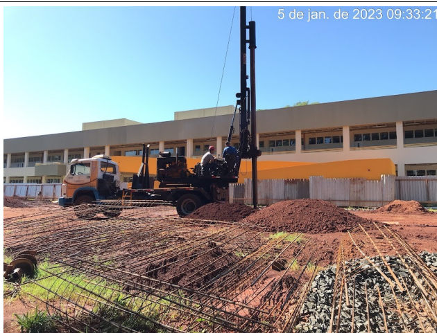
Figura 3 – Armação e furação de estacas