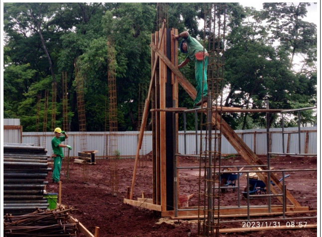
Figura 12 – Armação e forma de pilares