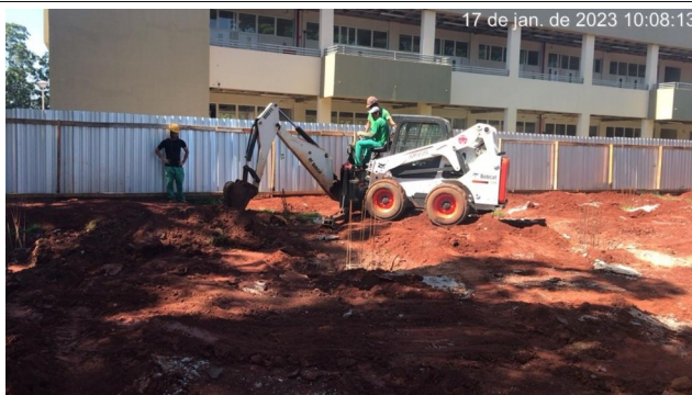
Figura 5 – Acertos de nível terreno