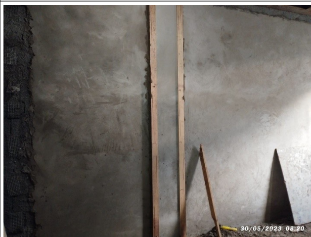
Figura 16 – Revestimento – Setor A