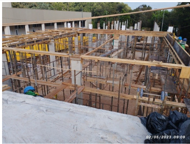
Figura 1 – Início de execução de formas – Cobertura - Setor B