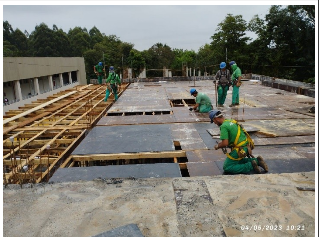
Figura 4 – Formas de Cobertura – Setor B