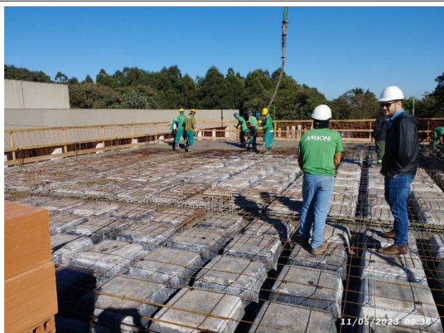
Figura 9 – Concretagem laje de Cobertura – Setor B