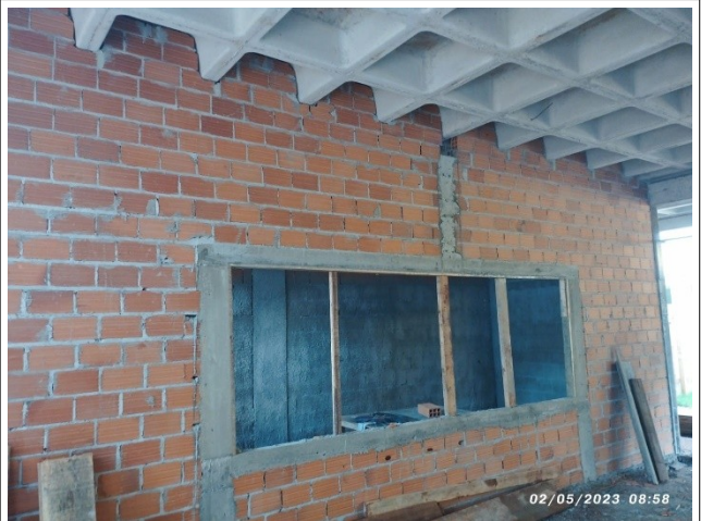
Figura 2 – Alvenaria térreo– Setor A