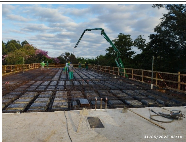
Figura 18 – Concretagem laje de cobertura – Setor C