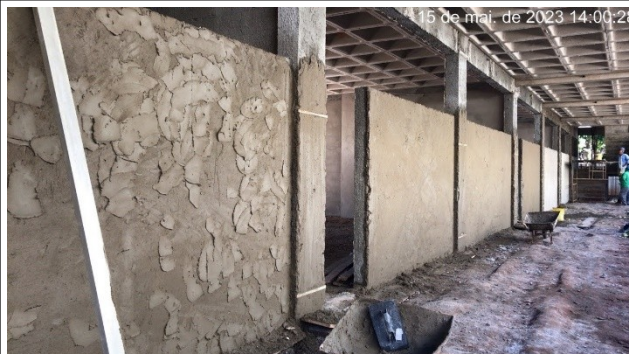
Figura 12 – Revetimento térreo – Setores A e B