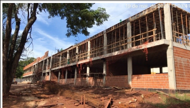
Figura 15 – Alvenaria térreo – Setor C