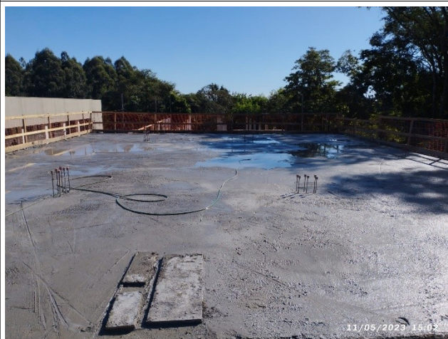
Figura 10 – Laje concretada – Setor B