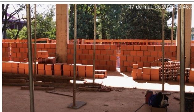
Figura 14 – Alvenaria piso superior – Setor B