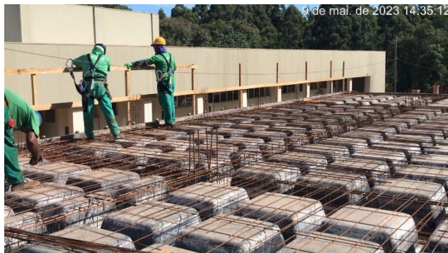
Figura 7 – Armação laje de Cobertura – Setor B