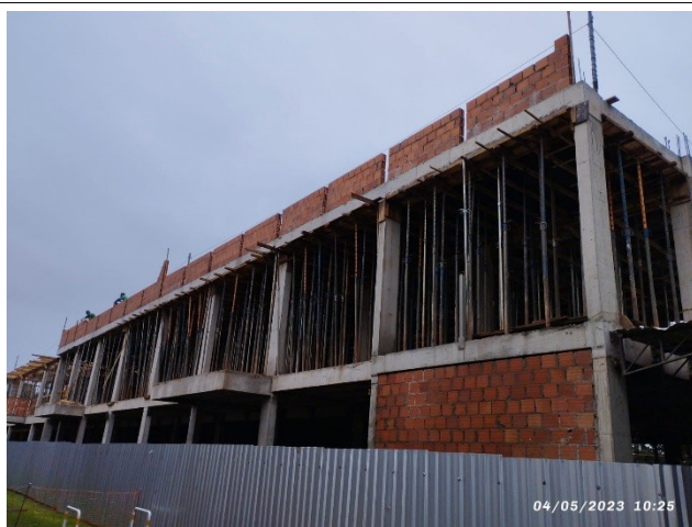
Figura 3 – Alvenaria – platibanda e térreo – Setor A