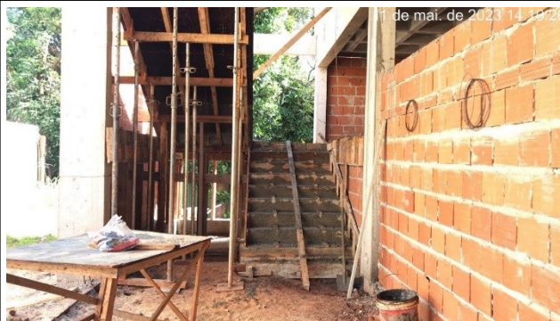
Figura 8 – Escada concretada