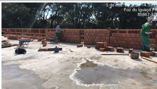
Figura 5 – Alvenaria – platibanda – Setor A