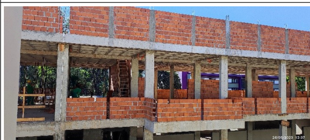
Figura 17 – Alvenaria 1º pavimento – Setor B