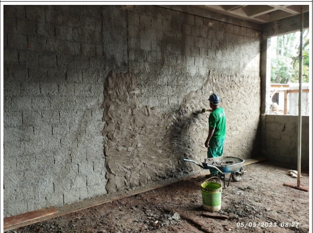
Figura 6 – Revetimento térreo – Setor A