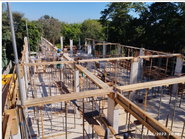
Figura 11 – Formas – Cobertura - Setor C