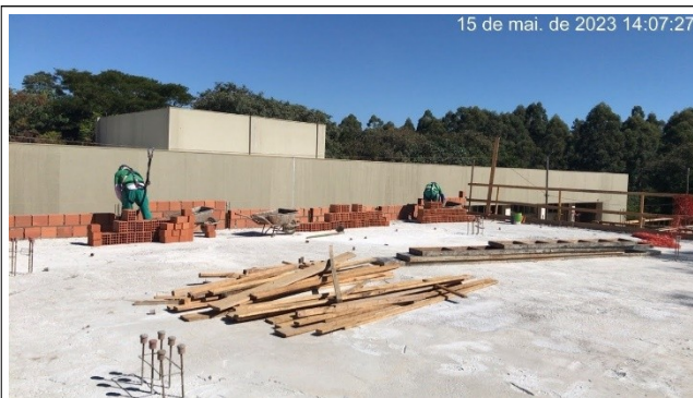
Figura 13 – Alvenaria da platibanda – Setor B