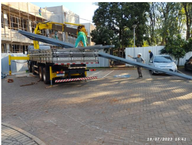
Imagem 11 – Recebimentos de estrutura metálica (treliças)