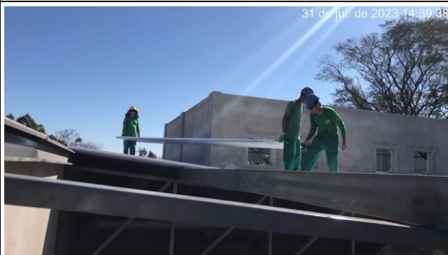
Imagem 17 – Telhamento de cobertura