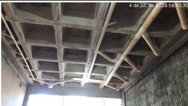
Imagem 5 – Tubulações de esgoto - Pav. Superior