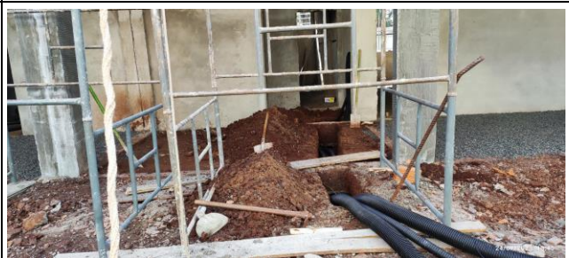
Imagem 16 – Infraestrutura (eletrodutos)