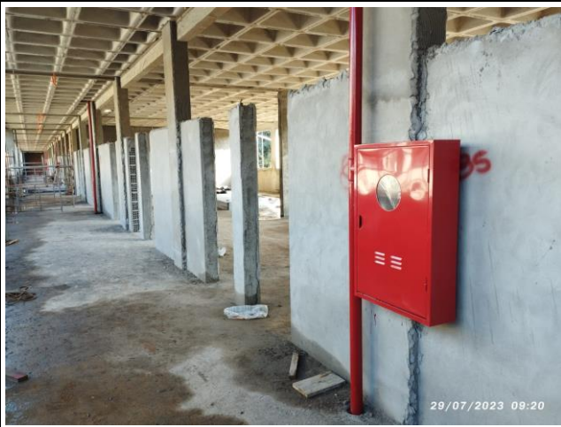
Imagem 13 – Caixa de Mangueira (Sistema de Prevenção e Combate a Incêndios)