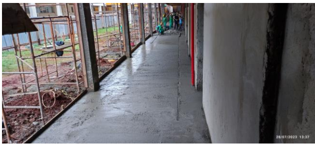
Imagem 19 – Concretagem laje de piso (Pavimento Térreo)