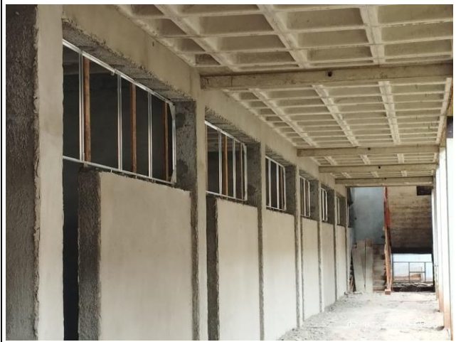
Imagem 8 – Contramarcos e revestimentos (Corredor) – Pavimento Térreo