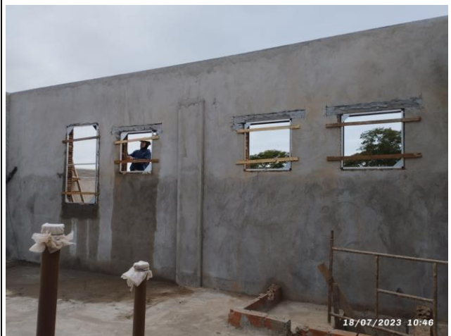
Imagem 12 – Revestimentos - Volume Superior