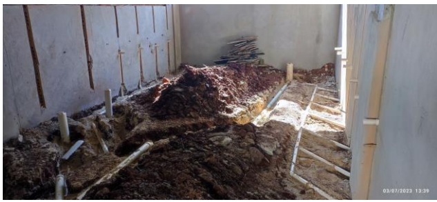
Imagem 1 – Instalações de esgoto - Térreo