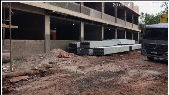
Imagem 14 – Telhas metálicas de cobertura