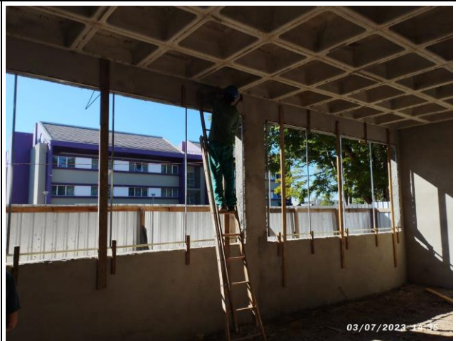
Imagem 4 – Fixação de contramarcos de esquadrias