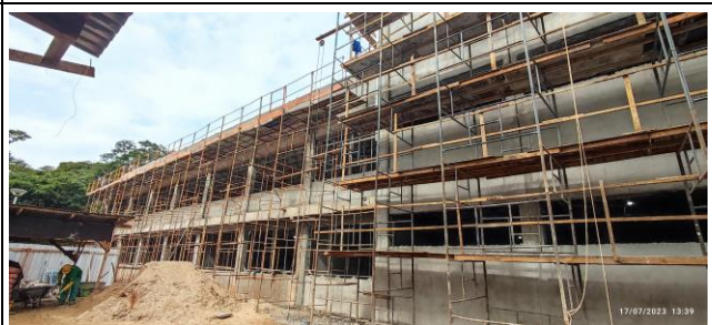
Imagem 10 – Vista geral (Andaimes)