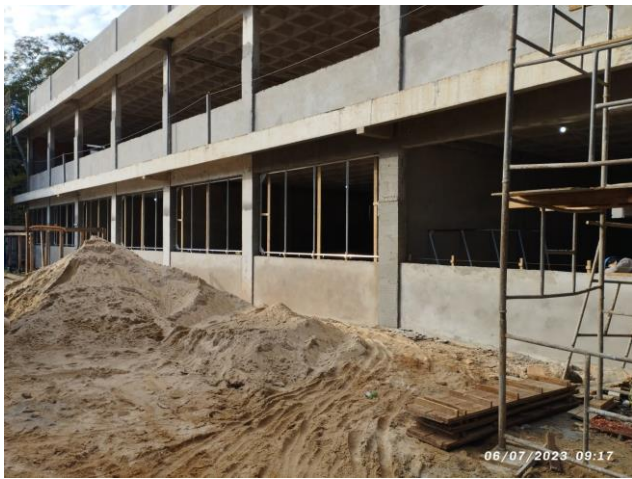
Imagem 7 – Revestimentos externos – Geral