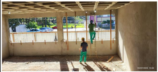
Imagem 2 – Revestimentos internos e contramarcos de esquadrias – Pav. Superior