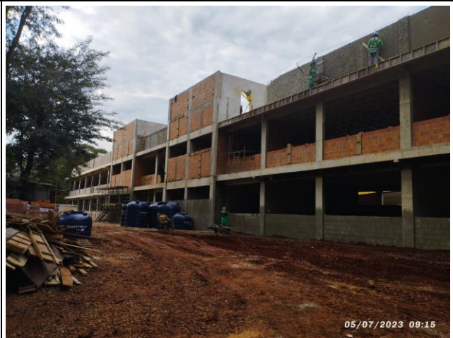
Imagem 6 – Vista geral platibandas e alvenarias (Setores B e C)