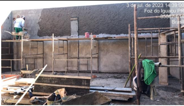
Imagem 3 – Revestimento em Alvenarias – Volumes