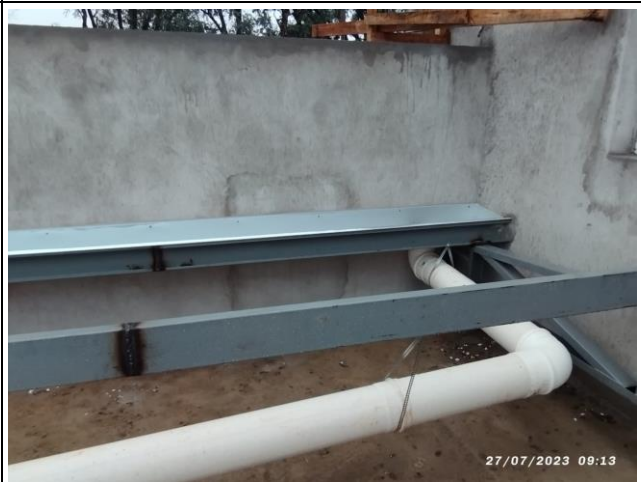
Imagem 18 – Instalação de calhas