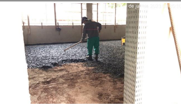
Imagem 9 – Lastro de brita - Pavimento Térreo