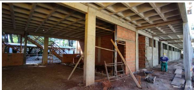
Figura 5 – Alvenaria Térreo – Setor B