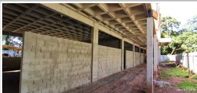
Figura 4 – Alvenaria térreo – Setor A