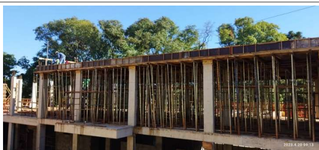
Figura 13 – Escoramento – Laje de Cobertura – Setor A