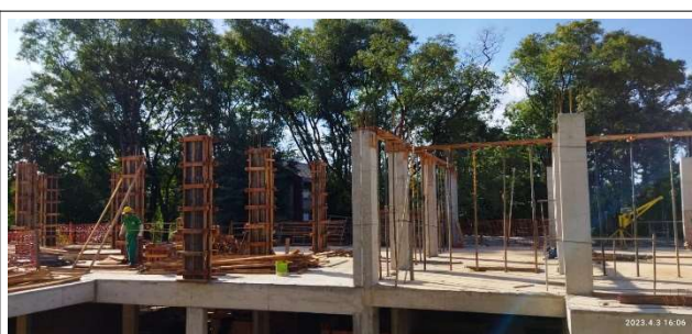
Figura 2 – Pilares de Cobertura – Setores B e C