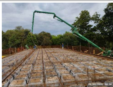
Figura 12 – Concretagem laje Piso Superior – Setor C