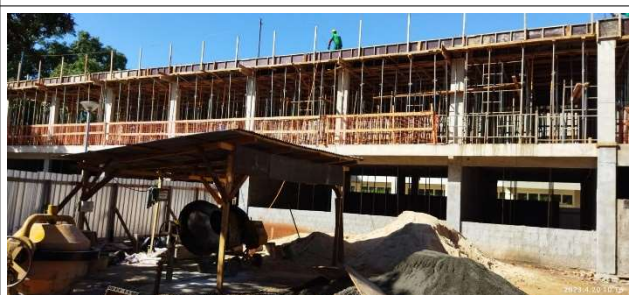
Figura 10 – Vista lateral – Setor A