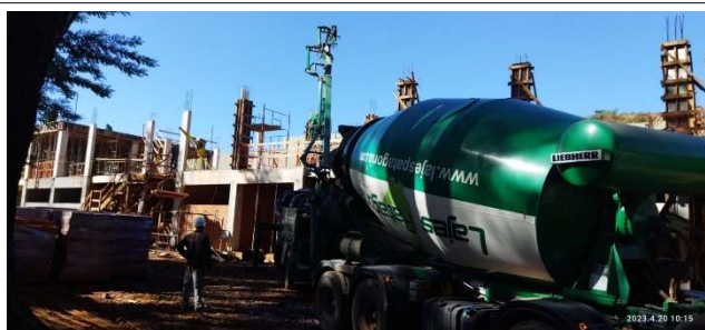
Figura 11 – Concretagem – pilares de cobertura - Setor C