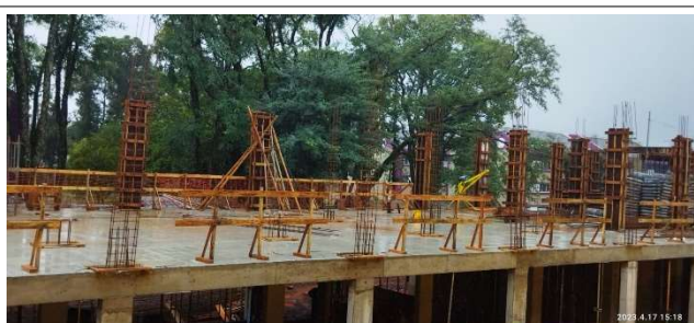
Figura 9 – Formas de pilares de Cobertura – Setor C