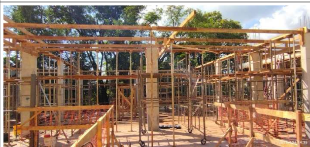
Figura 14 – Armação e forma de laje e vigas de cobertura – Setor B