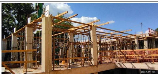
Figura 15 – Armação e forma de laje e vigas de cobertura – Setor B