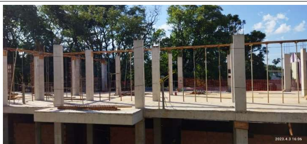
Figura 3 – Início formas de laje de Cobertura – Setor A