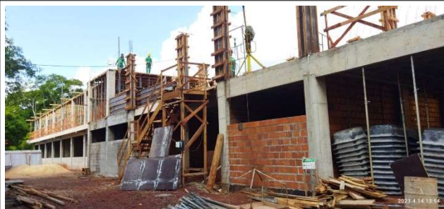
Figura 6 – Vista geral – Setores B e A.