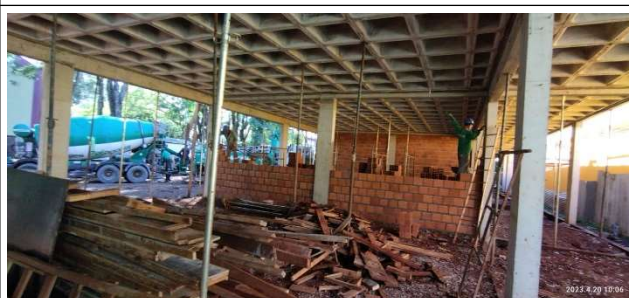
Figura 16 – Alvenaria térreo – Setor C