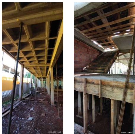
Figura 7 – Inferior de laje do Pavimento Superior e escada – Setor A