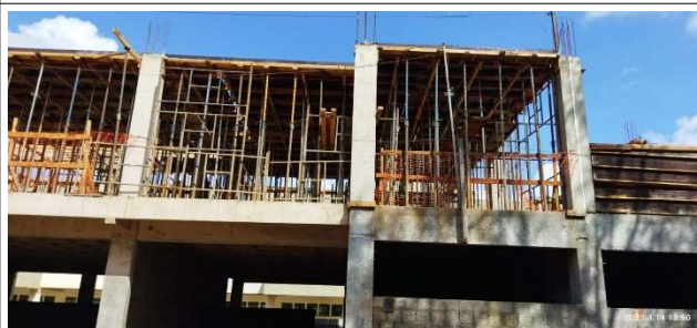
Figura 8 – Escoramento de laje de Cobertura – Setor B