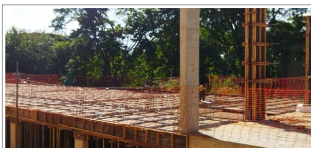
Figura 1 – Formas e armação – Pavimento Superior Setor C