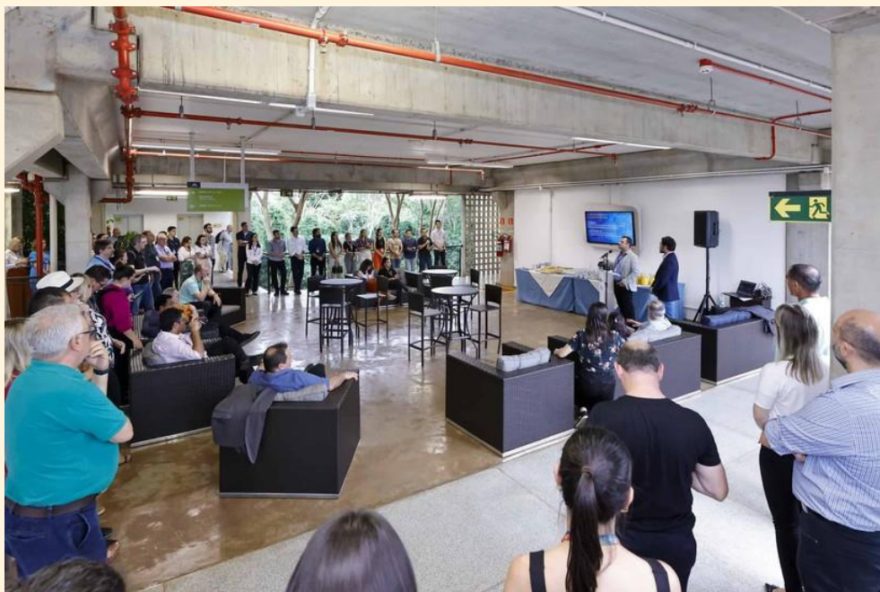
Inauguração do Escritório de Captação de Recursos e Investimentos