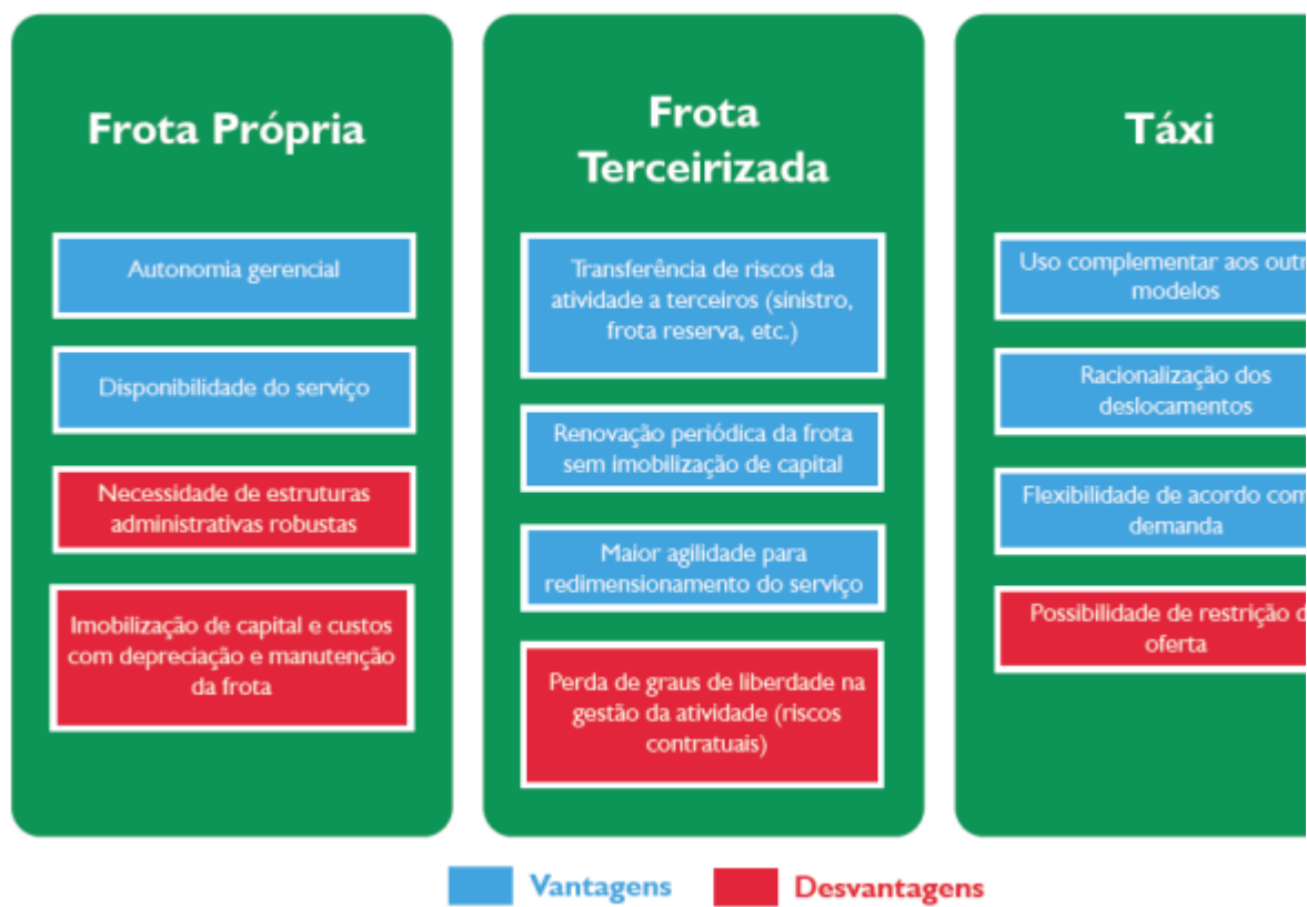
Modelos de prestação – Principais características