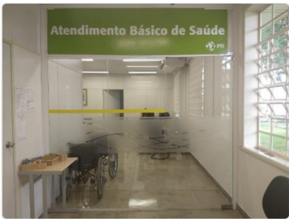
Sala de Atendimento Básico de Saúde, no PTI

O Departamento de Atendimento à Saúde (DEAS) oferta aos estudantes: