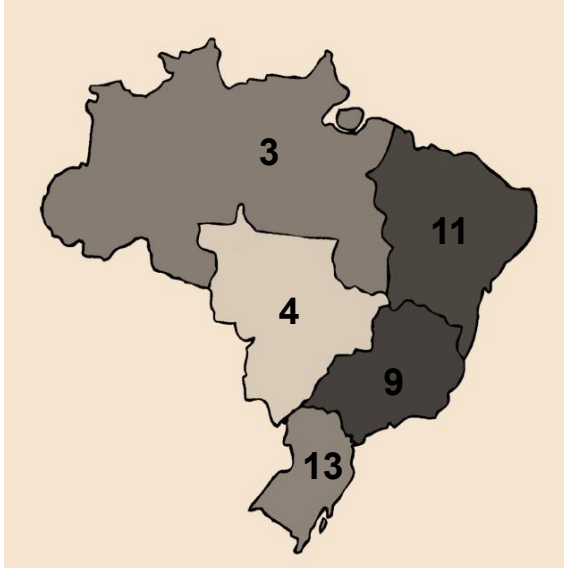
Fig. 1: Total de PPG Acadêmicos, por Região, 2019