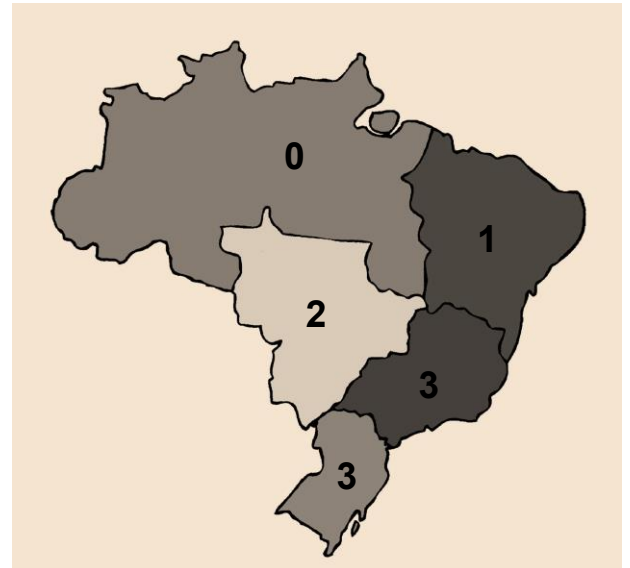
Fig. 2: Total de PPG Profissionais, por Região, 2019