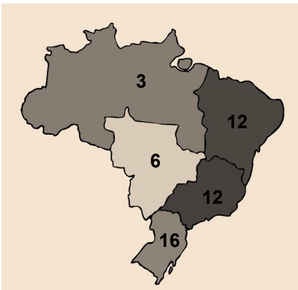
Fig. 3: Total de PPG por Região, 2019