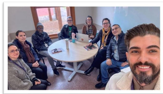
Reunião com Diretores dos Institutos da UNILA.

Democratizando os Processos Internos , promover a integração e comunicação com a comunidade interna da UNILA.